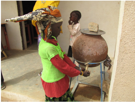
Water bij de school, enorm belangrijk als de temperatuur kan oplopen tot boven de 50 graden.

De kinderen zijn enthousiast, en de leerkracht niet minder. Het ontbreekt hem alleen aan ervaring, hij is dan ook enorm blij met onze toezegging een ervaren leerkracht te sturen voor drie maanden. Ook ons materiaal: de 500 gebaren dvd in Soninke en het gebarenboek evenals de trainingen in: Totale Communicatie en Visualisatie, en Free Hands, leren lezen en schrijven aan Afrikaanse dove kinderen, hopen we volgend jaar te kunnen realiseren.