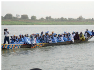
vrouwen onderweg naar het festival.