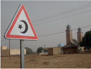
aanduiding moskee een waarschuwing of een aanbeveling!.