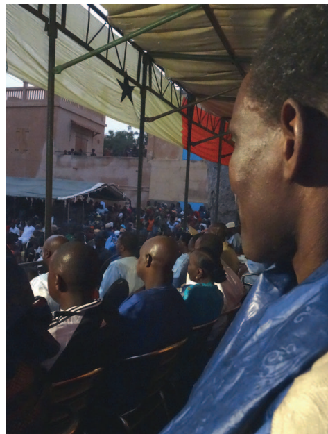
15.000 mensen genieten gratis van de muziek

We zijn nu drie dagen in Podor voor een festival van Baaba Maal om onderwijs voor kinderen met een beperking, dus ook voor dove kinderen, te promoten. Het is een driedaags festival. Op dit moment zit ik gewassen en gestreken in mooie kleren in het huis van deze grote artiest het reisverslag te schrijven.