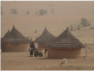
armoede of vrijheid