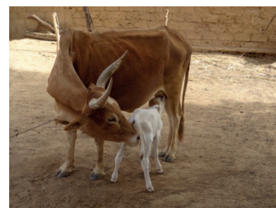
Africa heeft er dankzij goede gevers een koe en kalfje bij!