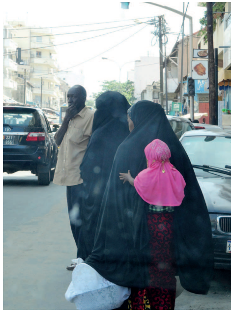
zo is het toch heel kleurrijk