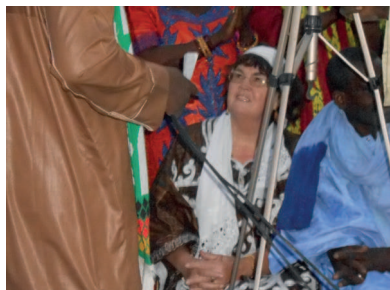
interview over Silent Work werk voor doven