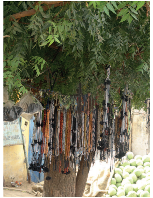
bidkettingen op weg naar de hemel!