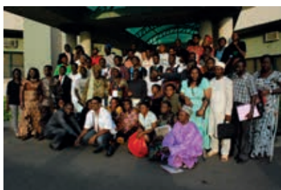
training voor regio Noord en West in Nigeria.