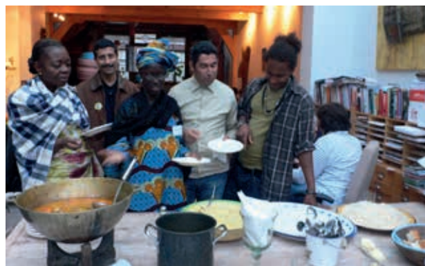
Afrika contactgroep congres in Haarlem komt bij ons thuis eten.