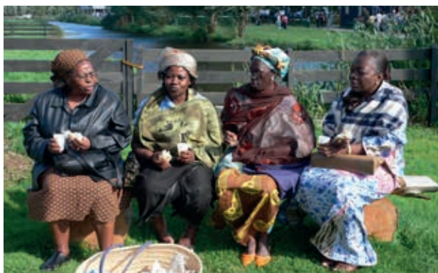
Afrika contactgroep op bezoek in Nederland.