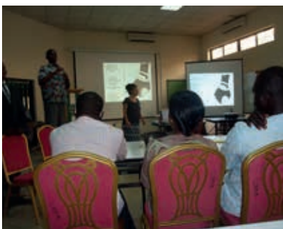
visualisatie training in Nigeria.