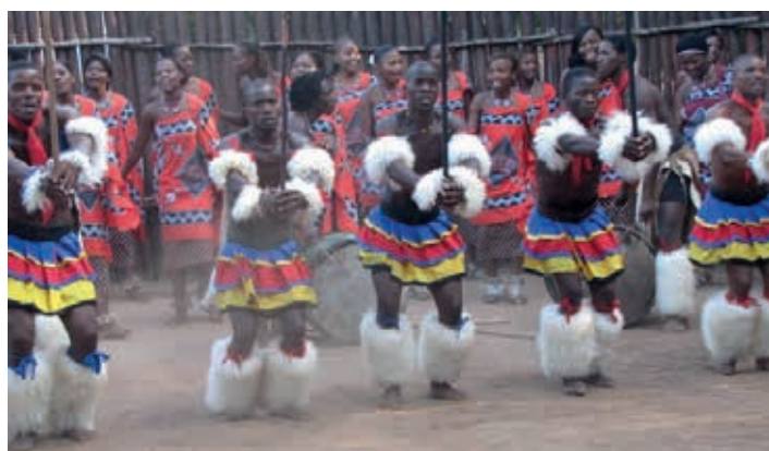
congres in Swasiland