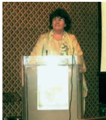
Woodi presentatie Zuid Afrika en Marokko