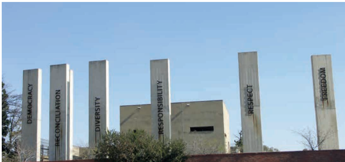
het apartheidsmuseum in Zuid-Afrika.

Een fijne sfeer, waarin hard gewerkt is om met weinig middelen zoveel mogelijk kwaliteit te leveren. Een belangrijke mijlpaal in het leven van Deafnet. Het geeft doven in Afrika door hun gebarende handen een stem.